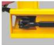
محور قابل تنظیم