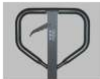
دستگیره با روکش کاملاً لاستیکی