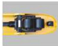
رولرهای ورودی جهت عملکرد آسان و طراحی نوین مجموعه چرخهای جلو