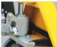
ظرفیت پمپ قابل تنظیم